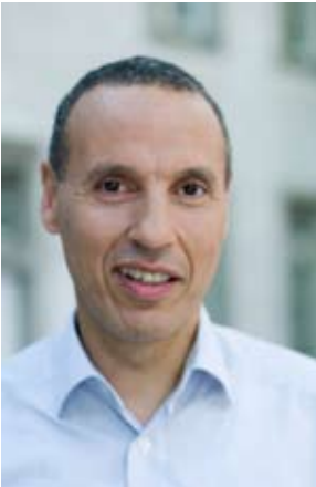
JÖRK CARDENEO PLATZ 12