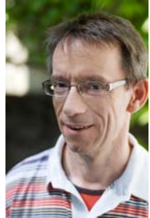
JENS PETRING PLATZ 8