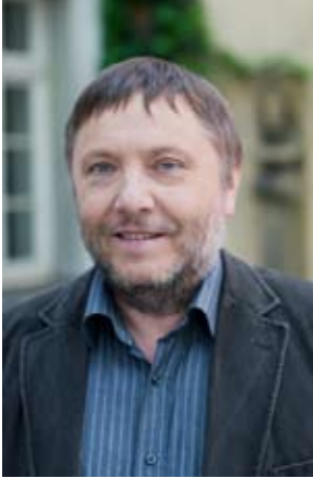
WOLFGANG SCHEFFLER PLATZ 6