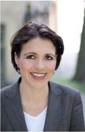
ASTRID WIESENDORF PLATZ 9