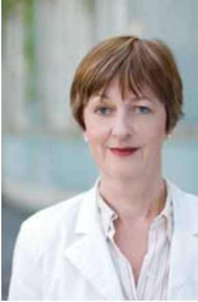
ANTONIA FREY PLATZ 3