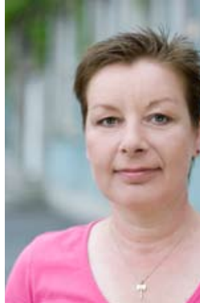
ANGELA HEBELER PLATZ 7