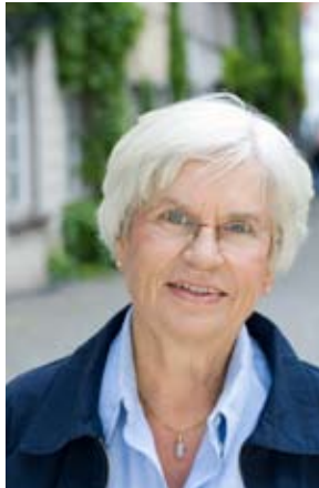
MARIT VON AHLEFELD PLATZ 13