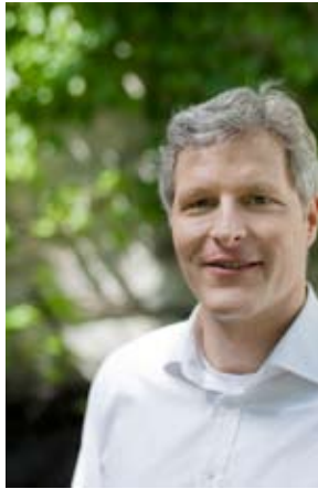
CHRISTOPH GORMANNS PLATZ 10