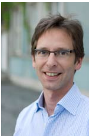
NORBERT CZERWINSKI PLATZ 2